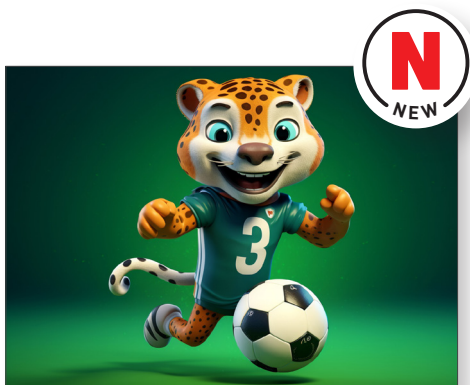
217215 Let's play football