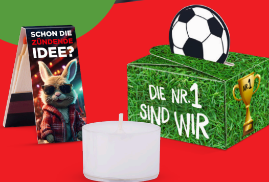
GESCHENKBOX MINI RUND

Du hast Fragen? Dann melde dich bei uns.