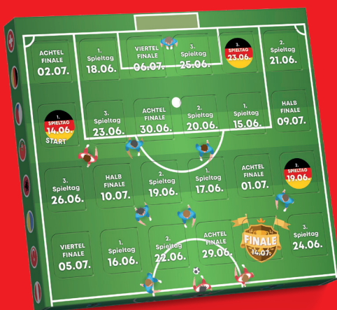
XS COUNTDOWN KALENDER