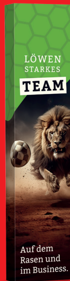
LONG BOX SHOT ICE 1ER