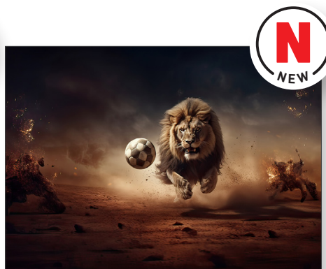
217216 Fußball Löwe